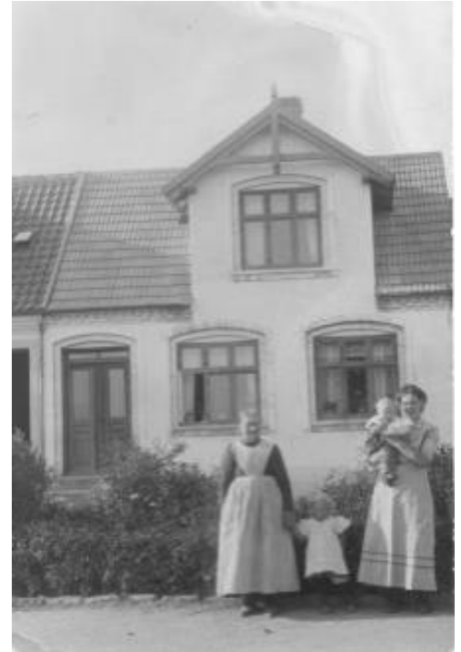
Fjordvej 40, ca. 1916